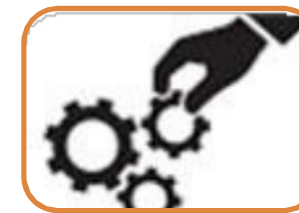
Dueño de cada control (responsable)