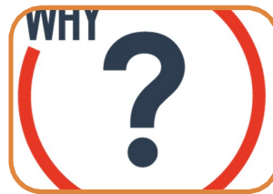
Causas del riesgo

Esta etapa consiste en determinar las causas y consecuencias de los riesgos identificados, como asimismo los controles que existan (respectivamente: preventivos de las causas, y correctivos de las consecuencias), y sus responsables :